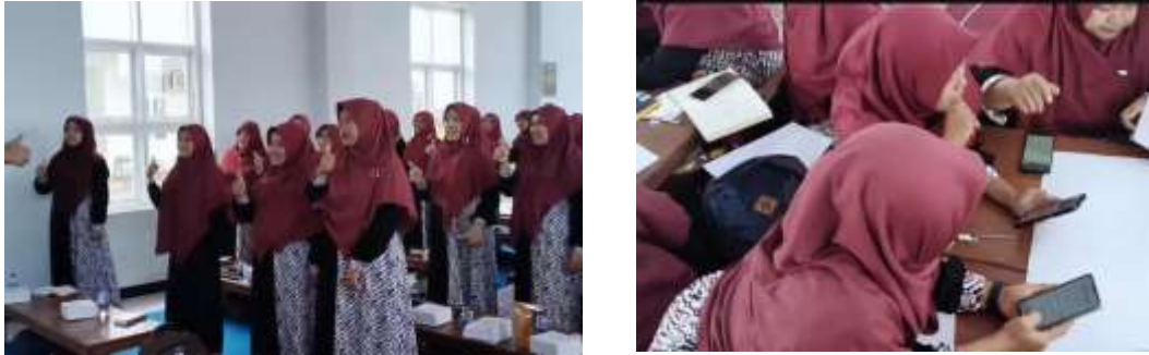
Gambar 2. Dokumentasi Antusiasme dan Interaksi Guru dalam Praktik Penggunaan Canva AI di SD Al Ishlah